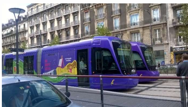
Au même moment passage du convoi officiel