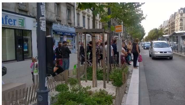
Attente du bus à l'arrêt provisoire

L'inauguration aurait dû être l'occasion d'inciter la population à découvrir et utiliser le nouveau tram. Comment comprendre que ce jour-là la ligne E soit interrompue pendant l'inauguration officielle pour laisser la place à deux rames roulant de front (sur les deux voies) et transportant élus et personnalités ? Les usagers devant se contenter eux de s'entasser dans des bus moins fréquents et de surcroit, coincés dans la circulation. Pour tout dire l'idée n'a pas été du goût des usagers car pour eux ce n'était pas vraiment la fête !