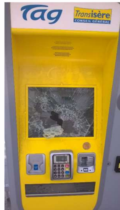
Distributeur de billets place Victor Hugo, récemment installé (BC)

Les agressions contre les chauffeurs et les contrôleurs représentent chaque année entre 5 000 à 7 000 jours d'arrêt de travail dont on peut imaginer les conséquences psychologiques pour les victimes. L'occasion de rappeler que la gratuité constituerait une amélioration importante des conditions de travail pour ces personnels et une source d'économie aussi bien pour la SEMITAG que pour la Sécurité Sociale.